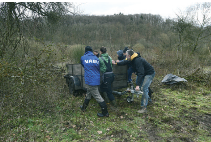
Arbeit am Bruthaufen. Alle packen an.