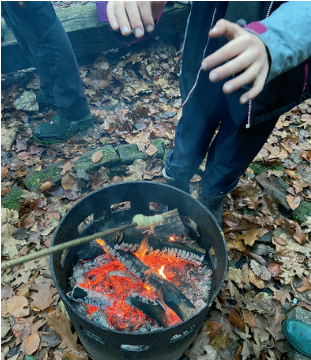
Stärkung mit Stockbrot

Anette Müllenschläder und Holger Kowoll kindergruppe@nabu-wuppertal.de