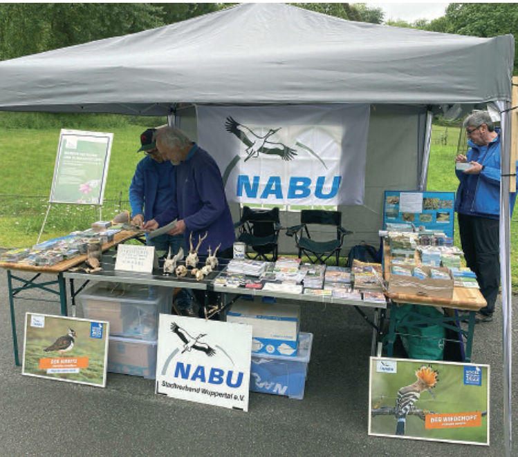
Naturschutz sichtbar machen! Hier im Wuppertaler Zoo.

Die hier aufgeführten Termine sind vorbehaltlich. Tagesaktuelle Informationen finden Sie online, siehe Seite 2. Zu den wiederkehrenden Veranstaltungen finden Sie nähere Informationen im hinteren Teil des Heftes.