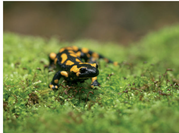
Der Feuersalamander ist nach dem Bundesnaturschutzgesetz besonders geschützt.

In Zusammenarbeit mit „Der Grüne Weg e.V.“ im Gebiet Schölller. Zeit: 4 Stunden mit Einkehr. Info und Anmeldung: hans-peter.schill@nabu-wuppertal.de .