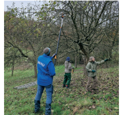
Arbeiten auf der Obstwiese.

Reiner Leppert, nabu.wuppertal@t-online.de