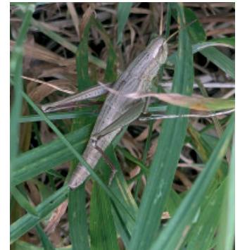
Große Goldschrecke. Die Weibchen sind an den leuchtend weinroten Unter- seiten von Hinterschenkel und -schiene zu erkennen.