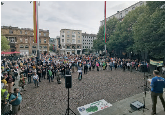
Grün Stadt Grau! Demo vor dem Barmer Rathaus.