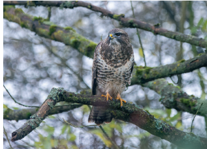
Der Mäusebussard baut seine Nester gerne in hohen Bäumen wie Eichen oder Kiefern.