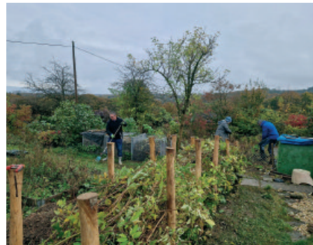
Aktiv im Naturgarten.

Die Termine werden auch auf unserer Homepage auf der Projektseite veröffentlicht: naturgarten@nabu-wuppertal.de .